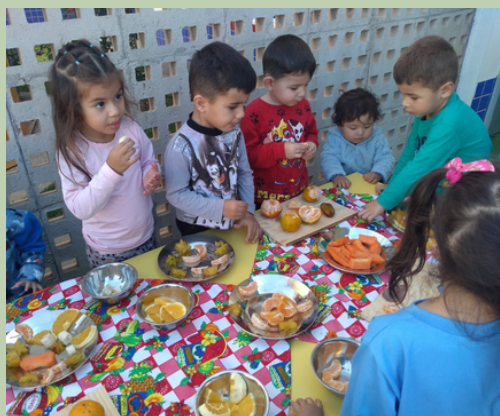
Saboreando frutas do pomar das famílias.