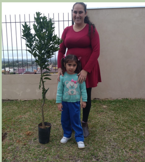
Muda frutífera doada pela família Kindler